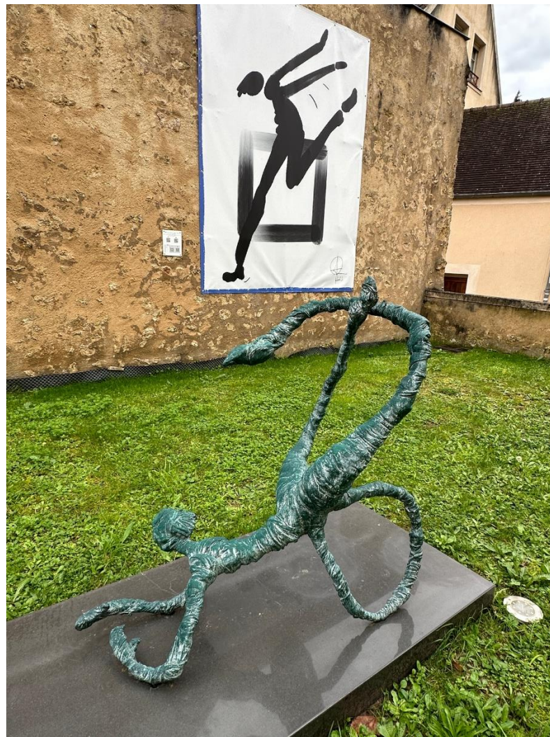
2023 – Jump it Make it Impression numérique et peinture acrylique Pièce unique - 310 x 237 cm

Enfin, tout est nécessairement en mouvement »