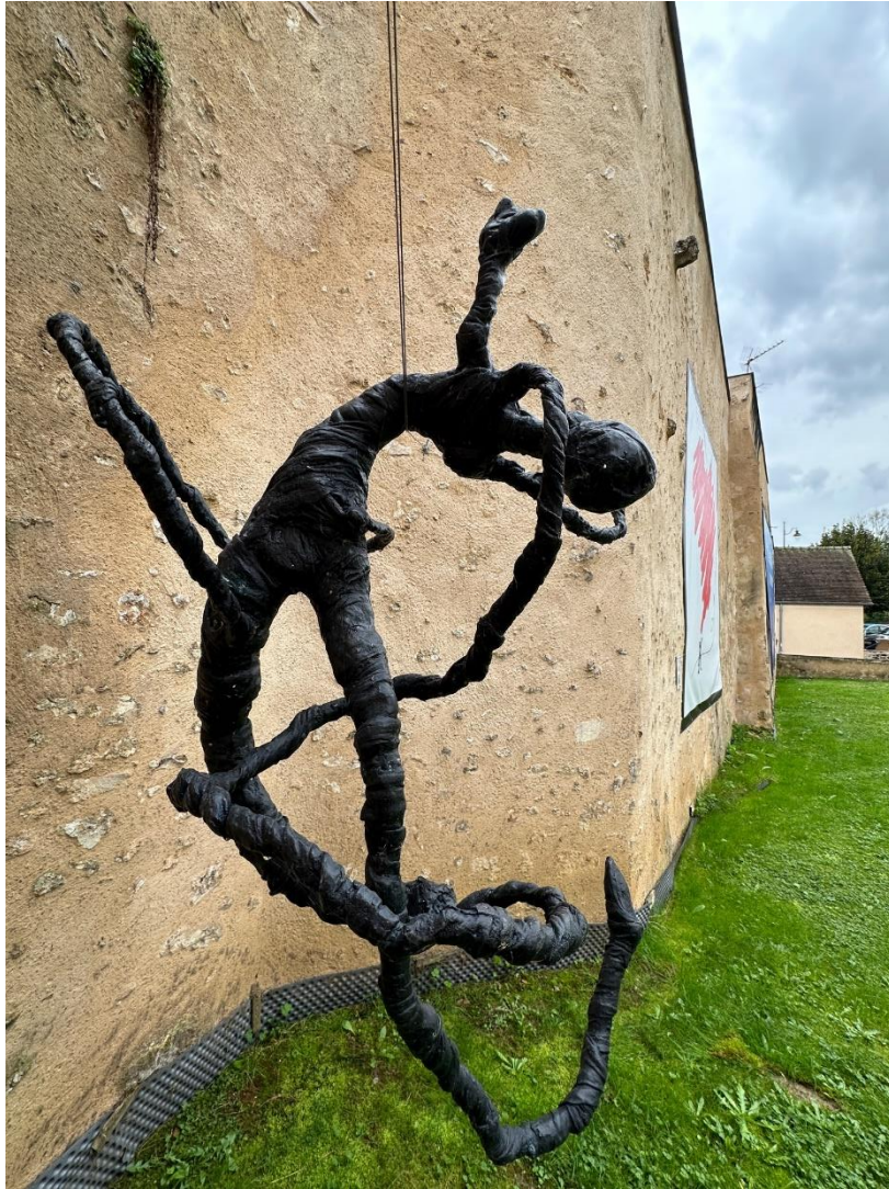
2011 - Aura Swing

« Nous sommes des particules d'énergie et d'information. Tout est communication énergétique. On se sent vivant »