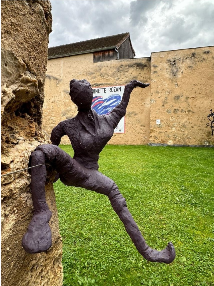
2009 - FREE Bronze 70 x 68 x 65 cm

« J'ai vécu 15 ans à Hong Kong dans un pays où les libertés sont de plus en plus contraintes. « Liberté » est un mot « compliqué » à entendre ou à vivre, ici ou là-bas. Les gens appellent naturellement « HAPPY » ma sculpture « FREE ». Finalement, c'est génial car la « liberté » c'est « happy ! »