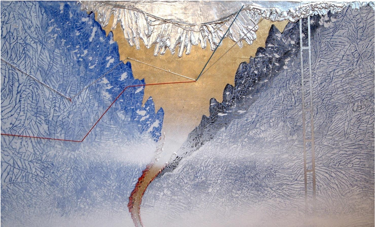
1992 - 2005 SYMBOLIQUE À LA MONTAGNE Technique mixte sur toile 150 x 260 cm

« Je suis un des derniers symbolistes sinon le dernier »